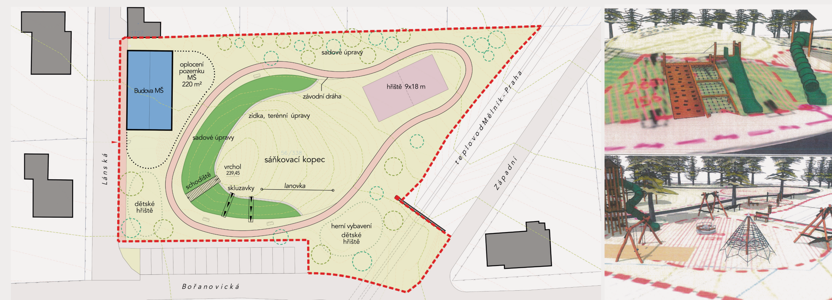
PŘEDPOKLÁDANÁ REALIZACE PROSTORU "SÁŇKOVACÍ KOPEC" A NÁVRHY HRACÍCH PRVKŮ

Při rozhodování o využití této plochy byly zohledněny i požadavky občanů ze všech částí obce na zřízení bezpečného terénu pro sáňkování v klidnější části obce než u hlavní silnice, kde děti doposud využívaly k zimním radovánkám svahy autobusových zastávek. Od modelace kopce, který máte před sebou, byl již jen krůček ke koncepčnímu řešení celého prostoru. Z příloženého výkresu z projektové dokumentace si můžete udělat obrázek o podobě celého záměru a postupu jeho realizace, která je závislá na finančních možnostech obce a případných dotacích. Připomínáme, že toto stanoviště naučné stezky vzniklo v roce 2021.