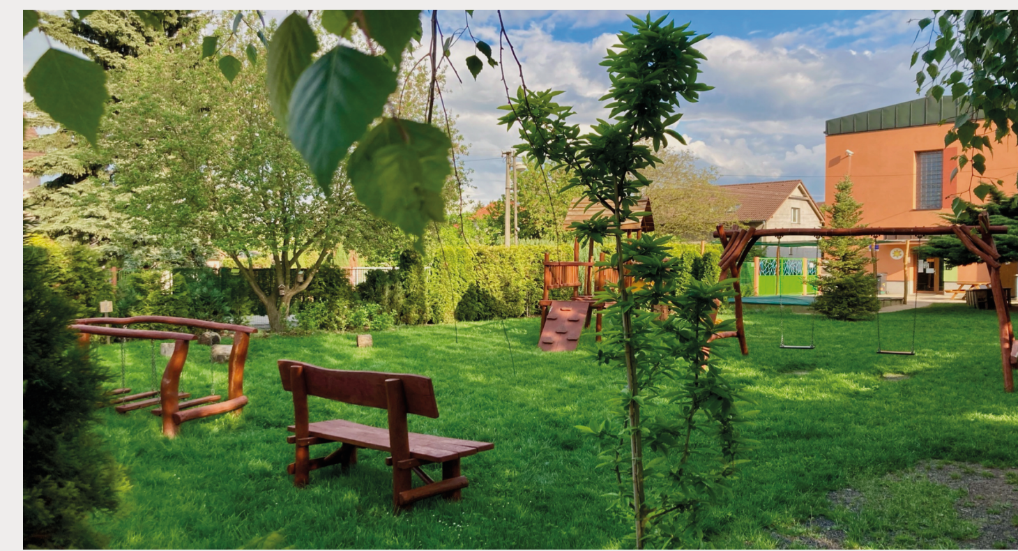
"ZAHRADA PRO VŠECHNY SMYSLY" U HLAVNÍ BUDOVY MŠ

V následujících letech se počet dětí neustále zvyšuje a s ním roste i počet zaměstnanců. Např. v roce 1997 mateřskou školu navštěvovalo 42 dětí, a to nejen zdejších, ale i z okolních obcí. S rozšiřující se výstavbou v obci a nástupem silných populačních ročníků se zájem o umístění dětí do mateřské školy neustále zvyšuje. Dochází k přestavbě mateřské školy a změně její koncepce. Přístavba nové třídy s provozním zázemím zvýšila kapacitu na celkových 112 dětí.