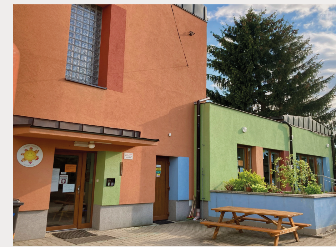
HLAVNÍ BUDOVA MŠ S PŘÍSTAVBOU Z ROKU 2011