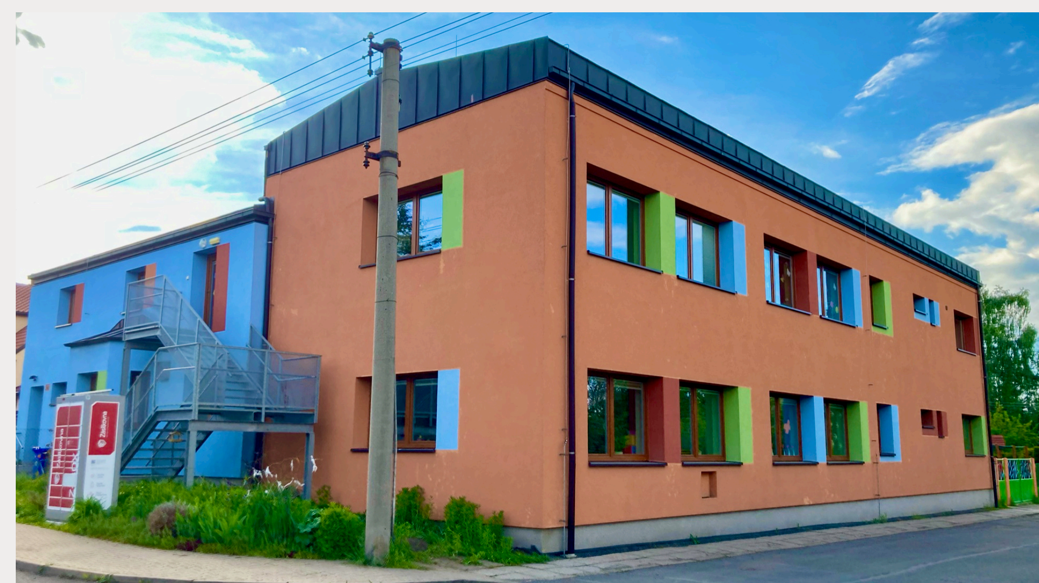
HLAVNÍ BUDOVA MŠ V ULICI BOŇANOVICKÁ