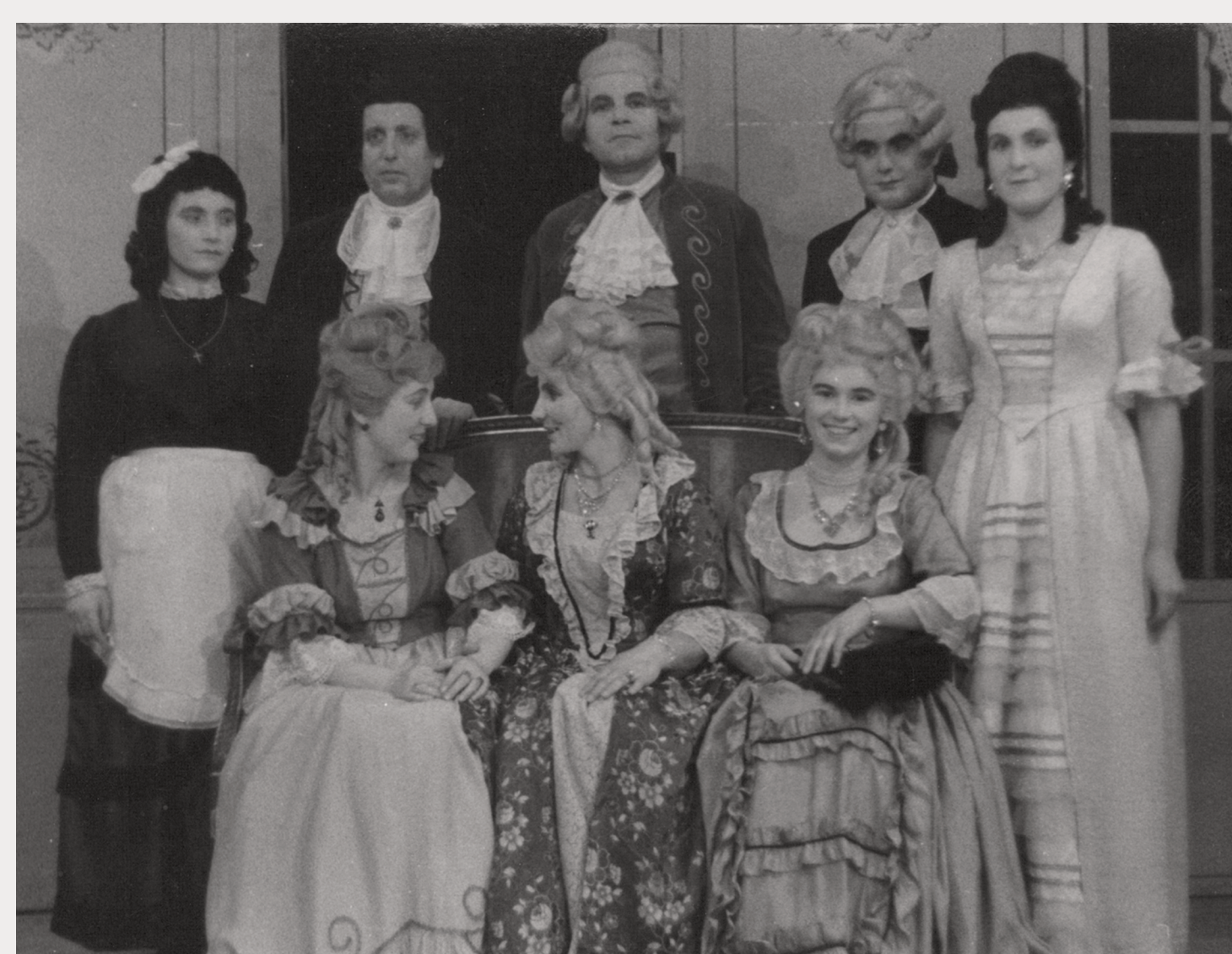
HRA "NOC S CASANOVOU" - 1966