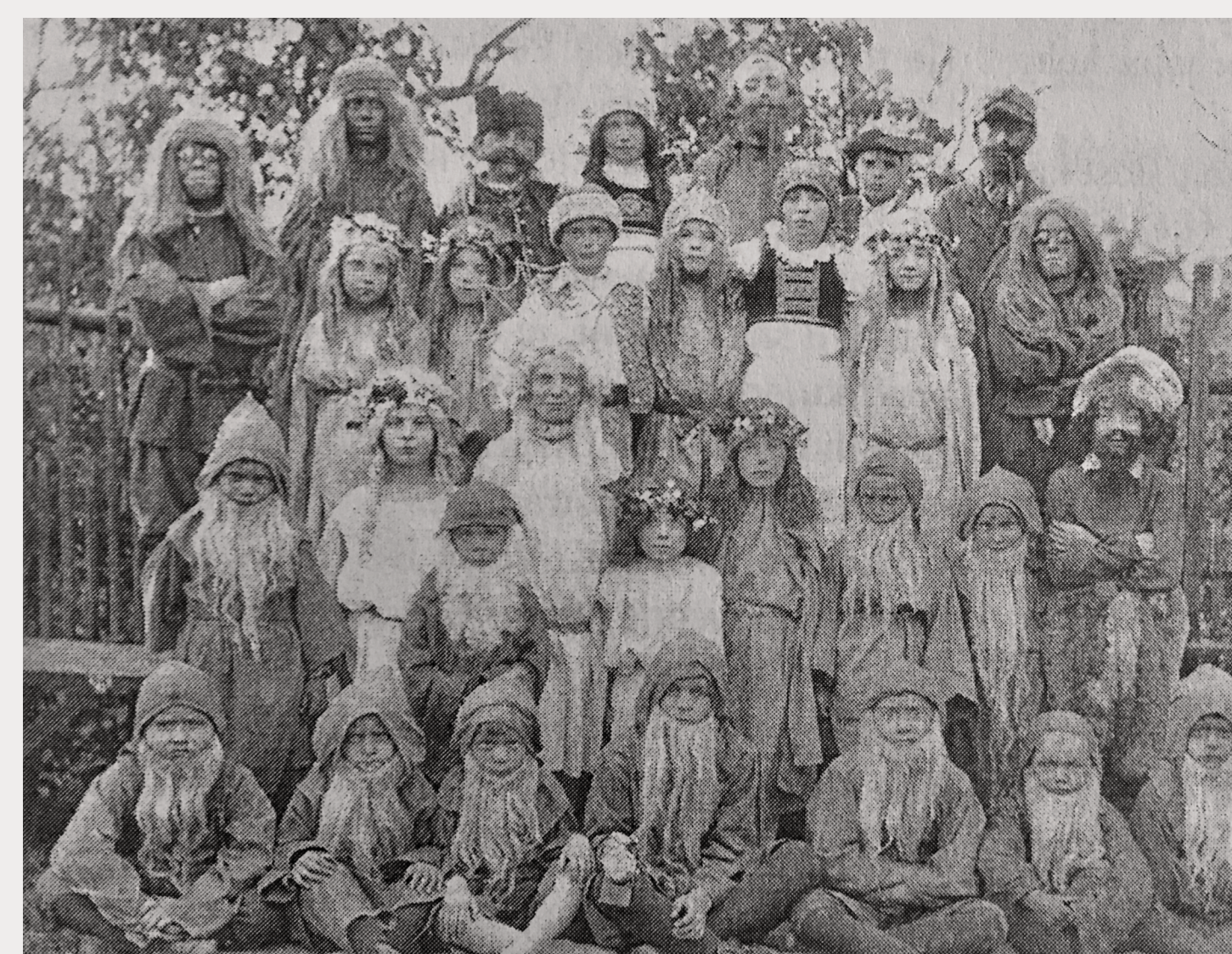
UNIKÁTNÍ FOTOGRAFIE Z DĚTSKÉHO PŘEDSTAVENÍ "ČAROVNÝ PROUTEK" - 1934

V roce 1964 hrálo divadlo naposledy. Následně bylo Národním výborem zakázáno právě z důvodu nevhodnosti výběru divadelních her.