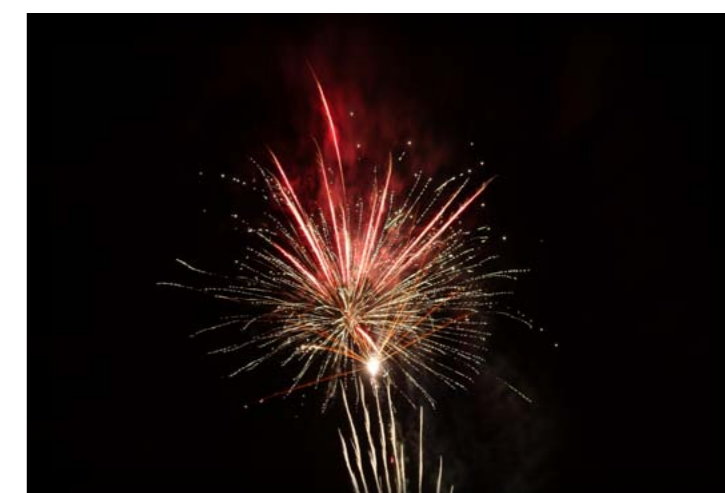
Závěrečný ohňostroj se letos i díky shovívavosti počasí velmi vydařil. Lampionový průvod s ohňostrojem 17.11.2017