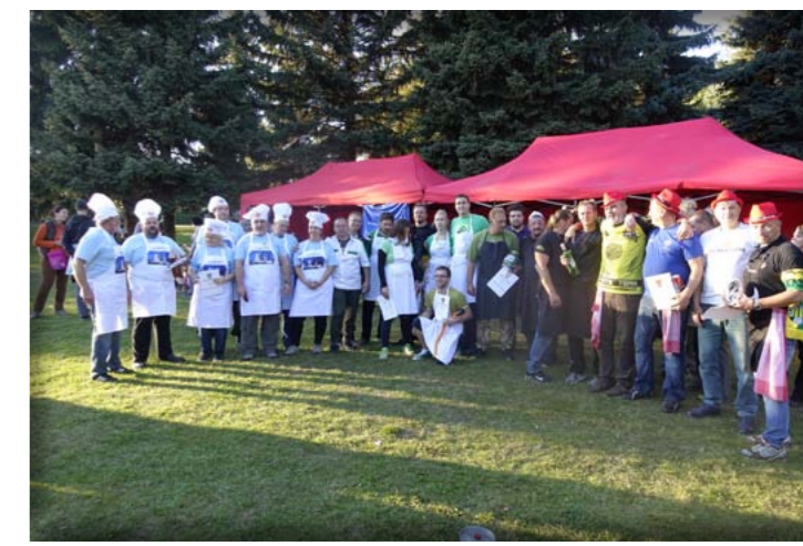
Mistři guláše. Někteří si dali na týmové prezentaci záležet.. Hovorčovický starostenský guláš 14.10.2017