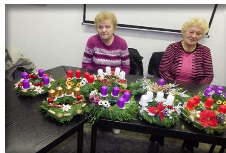
Listopadové setkání seniorů proběhlo již v atmosféře blížícího se adventu. Klub seniorů, 16.11.2017