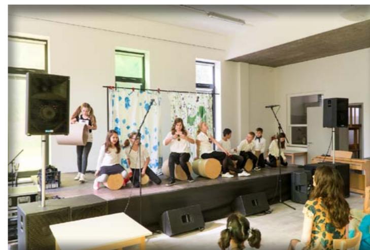
Vystoupení dětí z dramatického ateliéru Umělecké akademie při dni otevřených dveří v nové budově ZŠ. 23.9.2017