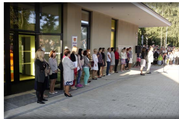
Zahájení školního roku před novou budovou ZŠ. 4.9.2017