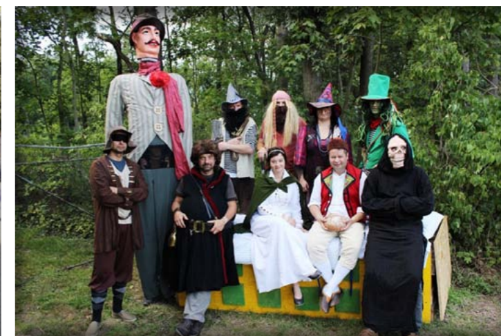
Pohádkové bytosti si daly sraz v Hovorčovicích ... Kouzelný les 9.9.2017