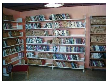
Nové vybavení místní knihovny