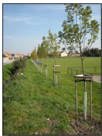
Akce SKK „Zasad' svůj strom“