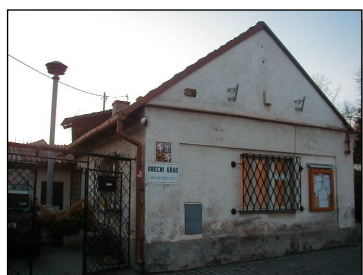
Budova OÚ v roce 2006