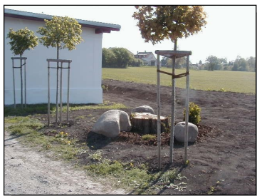
Úprava okolí zastávky ČD