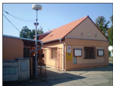
Budova OÚ v roce 2010