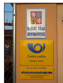
Výdejní místo pošty