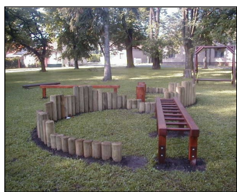
Dětské hřiště v parku v ulici Nádražní