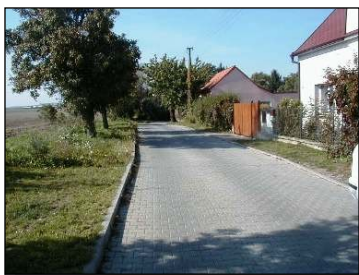
ulice Souběžná a Jižní