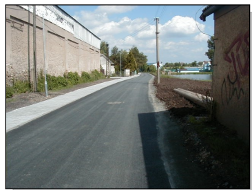
ulice U Rybníka