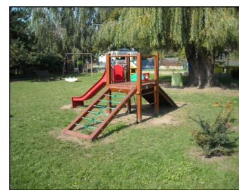
Dětské hřiště v MŠ přístupné veřejnosti