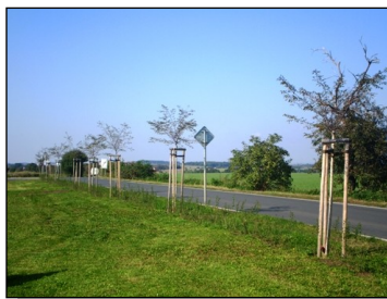
Nové stromy podél komunikace na Líbeznice