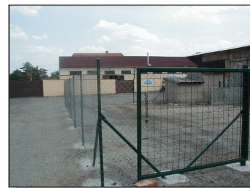
Sběrný dvůr na místě bývalé černé skládky