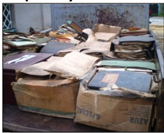
Archiv obce v roce 2006