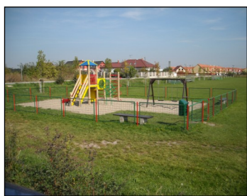
Dětské hřiště na fotbalovém hřišti