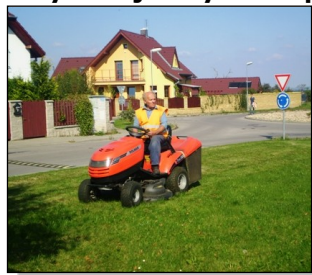
Údržba obecní zeleně