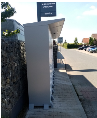
Obr.4 – Alzabox zabírá chodník

Pan Jandovský na veřejný pozemek v jeho vlastnictví nechal umístit Alzabox bez souhlasu obce – viz fotografie na obr. 4 a 5. Alzabox jednak zužuje chodník na cca 75 cm a jednak je umístěn přímo proti chodníku na protilehlé straně ulice Bořanovická.