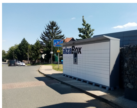
Obr.5 – Celkový pohled