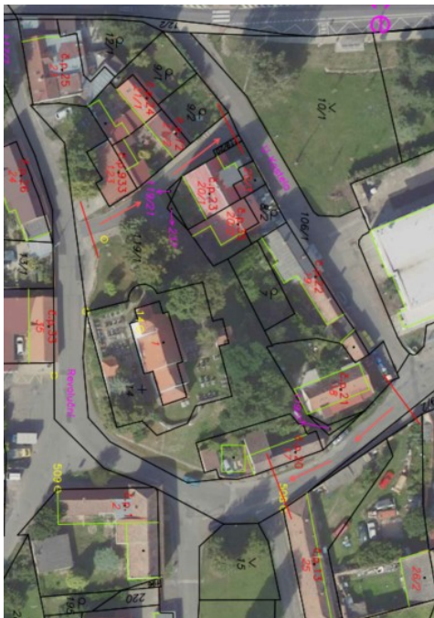
Obr. 1 – návrh jednosměrného provozu v ul. Revoluční a ul. U Kostela