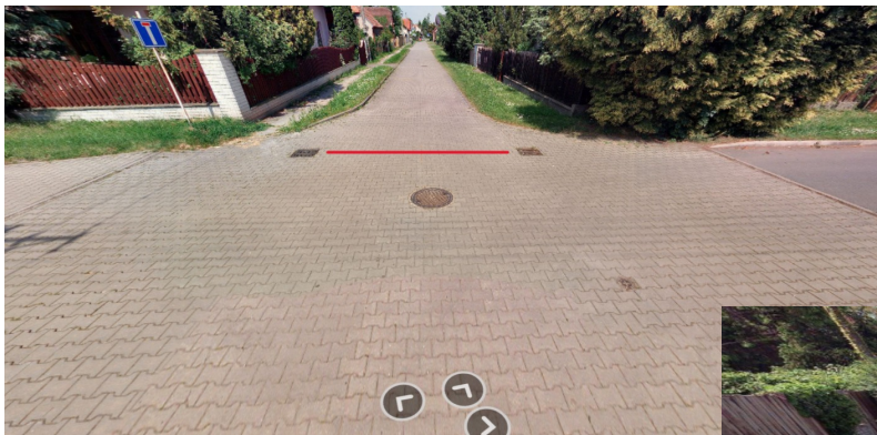
Obr. 4 – Křižovatka Dlouhá x Souběžná – umístít žlab