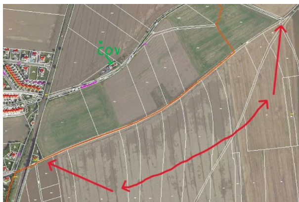
Obr. 1 : Výřez z mapy, rozsah obnovení polní cesty

V první fázi by se obec Hovorčovice měla podílet zajištěním geodetického vytýčení pozemkových hranic v terénu a získání potřebné podpory ze strany obce Veleň.