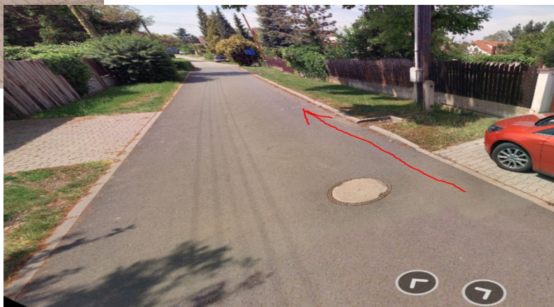
obr. 5 – Ulice Dlouhá – kanál umístěn výš než okolní povrch