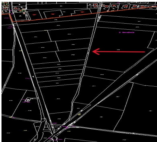
Obr. 2 : Pozemky historické cesty z Třeboradic do Hovorčovic