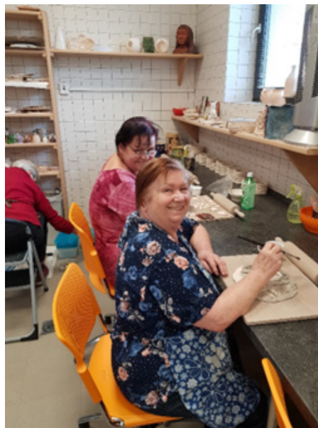
Seniorky v rámci kroužku keramiky