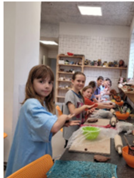
Žáci při výuce keramiky