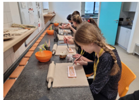
Žáci v rámci akcí Erasmus+