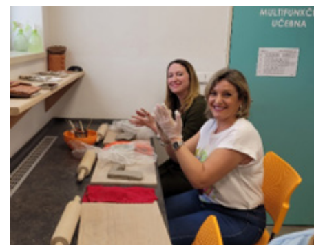
zahraniční pedagogové v rámci Erasmus+