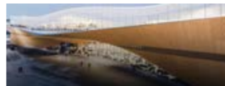
Nebeská knihovna Oodi v Helsinkách

Na závěr našeho studijního pobytu v Helsinkách nás čekala návštěva ve finské národní knihovně Oodi, kterou všem vřele doporučuji.