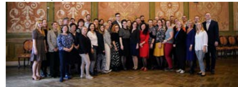
„Teachers House“ setkání se zástupci zřizovatele magistrátu města Tallin

Je to funkce místní školské správy. Ve Finsku i Estonsku jsou sice zřizovateli většiny škol stejně jako v Česku obce,