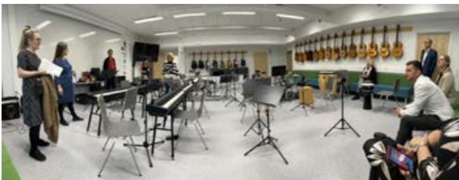
Školní učebna pro hudební výuku v Tartu

Dalším městem, které jsme v Estonsku navštívili, bylo město Tartu, které je nazýváno univerzitním městem, protože je zde umístěno ministerstvo školství a pedagogická univerzita. V něm jsme navštívili opět šest škol různých druhů a velikostí. Přivítání jsme byli i na radnici města Tartu, kde nás zástupci města a zástupci celostátní a regionální asociace ředitelů škol seznámili se vzděláváním v regionu Tartu.